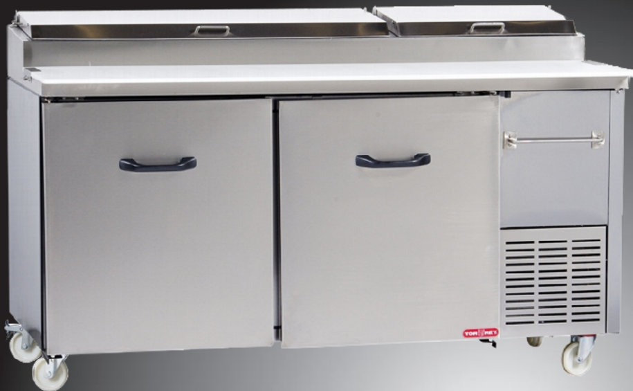
Modelo PTP 170-11