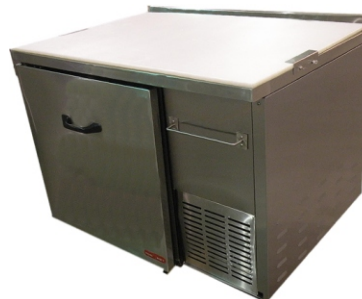
UBT Mesa Bajo Barra

La limpieza también es muy fácil ya que son totalmente desmontables.