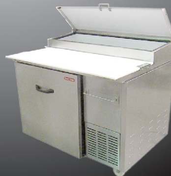
Modelo PTP 112-10