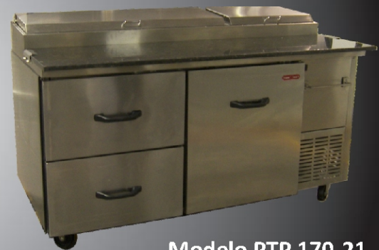
Modelo PTP 170-21 Mesa de Granito